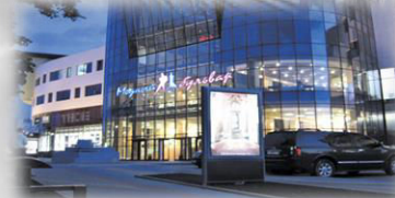
ТЦ Модный бульвар

Россия, г. Белгород пр-т Б. Хмельницкого 111 (южная проходная завода «Энергомаш»)