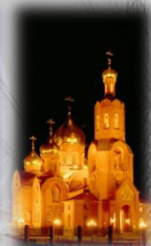
Храм г. Губкин