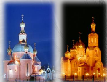
Храм п. Дубовое