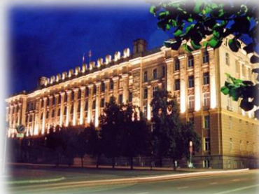
Администрация Белгородской области