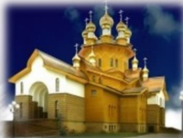
Храм Веры, Надежды, Любви и матери их Софии