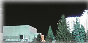
БГТУ им. В.Г. Шухова